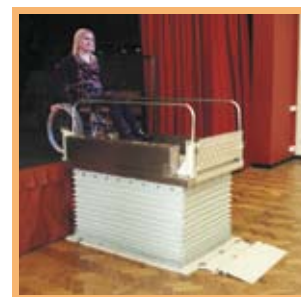
Conçue pour transporter une personne en fauteuil roulant entre deux niveaux séparés par une hauteur de 1 m maximum