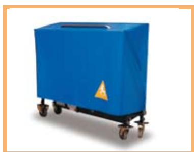
Facile à transporter avec son système à roulettes