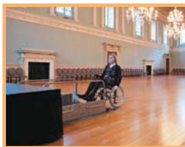
Système autonome pouvant être installé sans dommage dans n'importe quel lieu