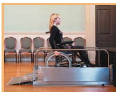
Plate-forme large, robuste et fiable