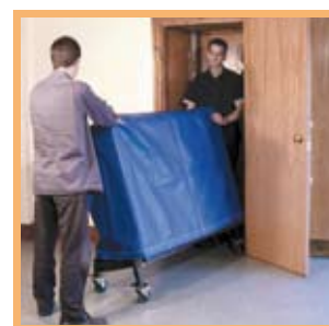
Stockage aisé une fois repliée en position verticale