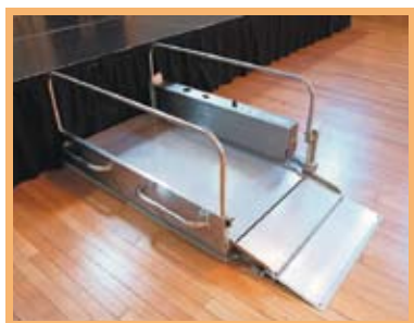
Rampe d'accès basse à la plate-forme mobile