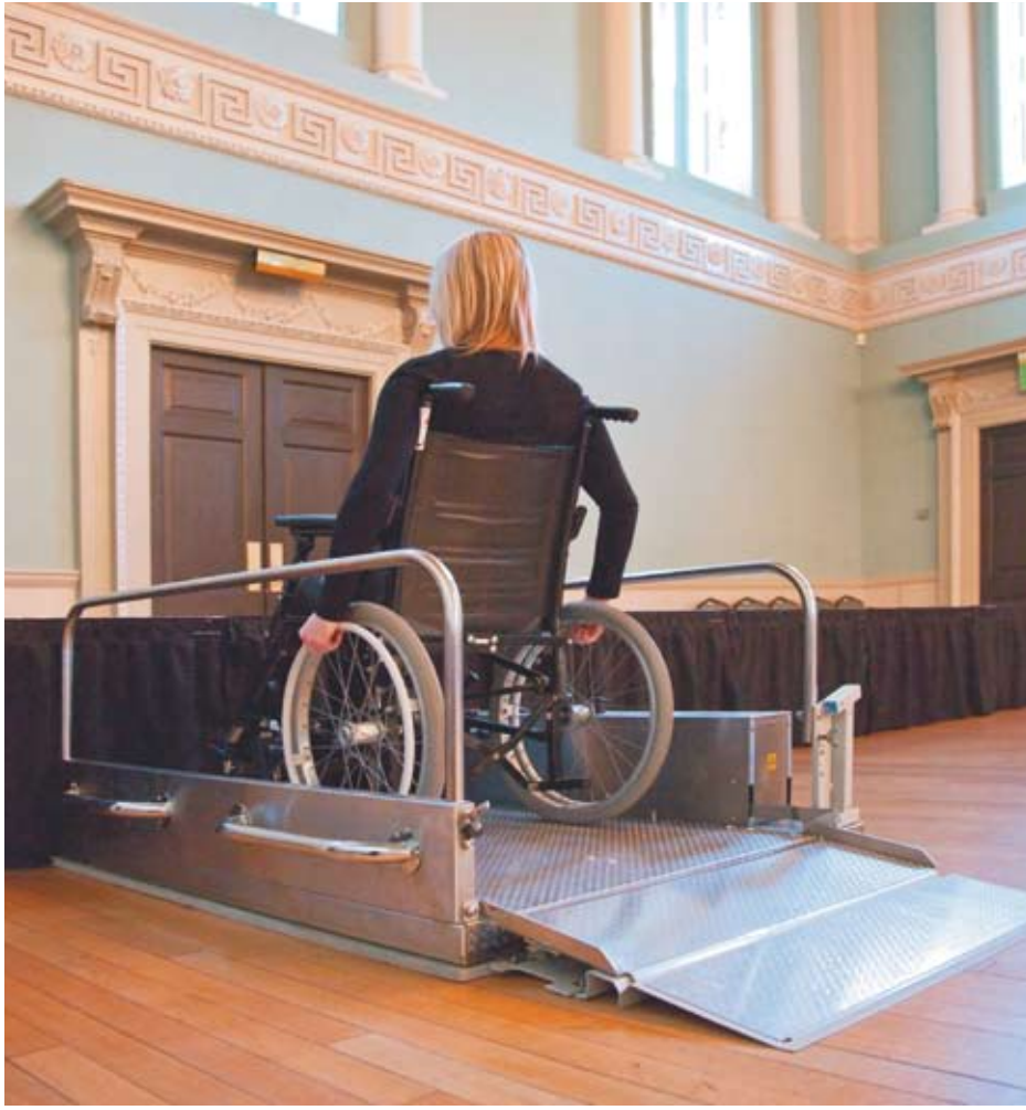
PLATE-FORME ÉLÉVATRICE MOBILE SD1000